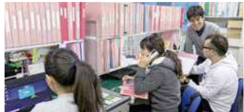
あいりす事務所内の様子

ご利用にあたっては別途ご契約が必要になりますので、詳しくは当訪問看護事業所にお問い合わせください。(訪問エリアは、福岡市内全域、糸島市、春日市、大野城市、那珂川市、糟屋郡粕屋町・志免町など)