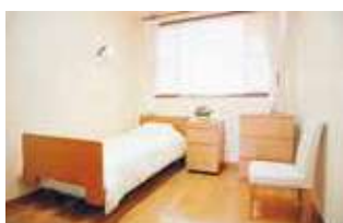
病棟内の一般的な個室 救急病棟内にはプライバシーを考慮した19室の個室があります。

かで安全な場所を患者さんに提供することを目的としています。また、身体拘束の目的は、言うまでもなく生命の保護です。 精神科におけるこれらの行動制限は、精神保健福祉法で認められていますが、加えて私たち精神科医療機関のほとんどが院内に行動制限最小化委員会を設置し、常に患者さんの人権を尊重し、自らに適切な行動規範を課し、隔離や拘束の削減に向けて日々取り組んでいます。 当院では身体拘束の際に法令で定められている医師の回診のみならず、看護師の