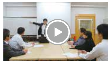
※うつ病リワークプログラムの様子は油山病院ホームページでご覧いただけます。