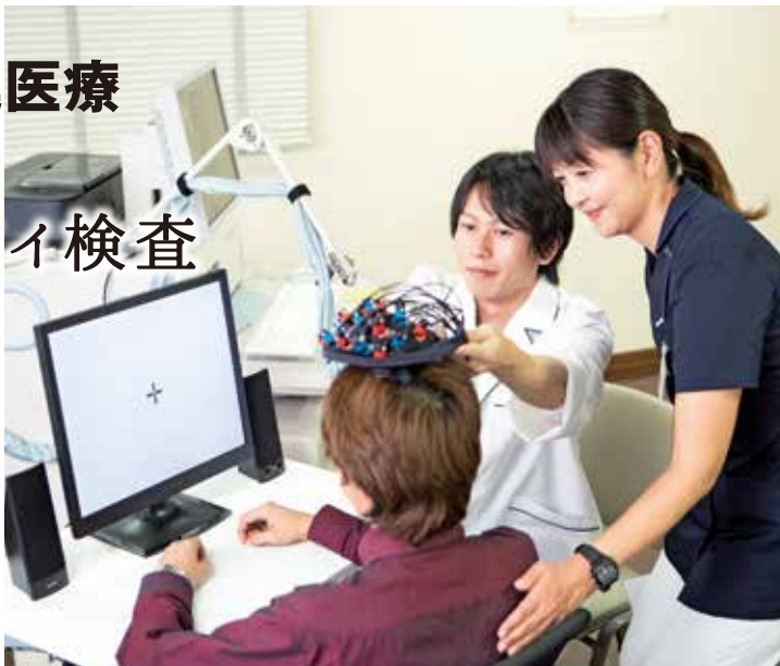
(提供：日立製作所 ETG-4000機器)